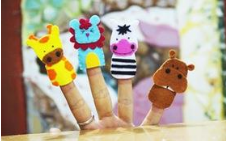
Rối ngón tay