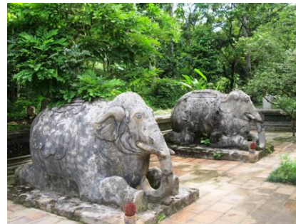
Tượng voi ( Lăng miếu Lam Kinh)