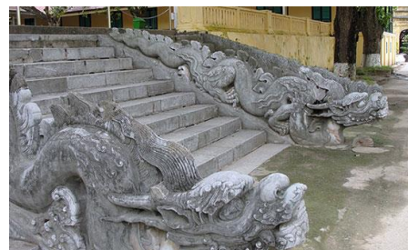
Bệ rồng điện Kính Thiên