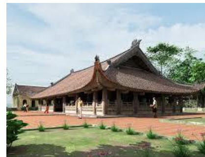
Đình Chu Quyên – Hà Tây