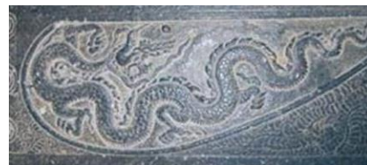
Hình rồng – Bia Vĩnh lăng + Nghệ thuật gôm