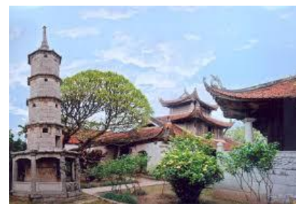
Chùa Bút Tháp – Bắc Ninh