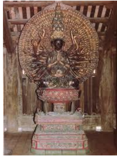
Tượng Phật Bà Quan Âm nghìn mắt nghìn tay