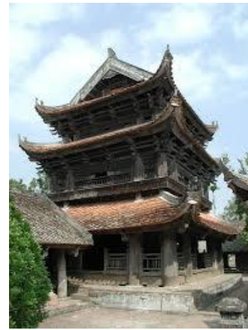
Chùa Keo – Thái Bình