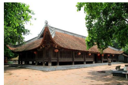
Đình Bảng – Bắc Ninh