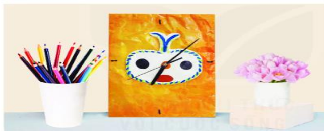
Đồng hồ sử dụng hoa văn hình khắc trên vách đá hang Đồng Nội, sản phẩm mỹ thuật đa chất liệu, Ngô Quang Tuyền

Trang trí góc học tập có sử dụng hình ảnh từ di sản mỹ thuật Việt Nam thời kì Tiền sử