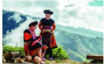
Thêu thổ cẩm, Lào Cai