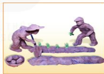
Trồng cây , sản phẩm mỹ thuật từ đất sét, Đoàn Mai Trang