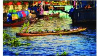
Đi chợ trên sông, Sóc Trăng

Cuộc sống xung quanh mở ra cho chúng ta rất nhiều ý tưởng có thể khai thác trong sáng tác mỹ thuật. Chính những hình ảnh của cuộc sống và tự nhiên đã tạo nên cảm hứng để thể hiện chủ đề mỹ thuật với những hình ảnh, màu sắc tươi mới theo ý thích của mình.