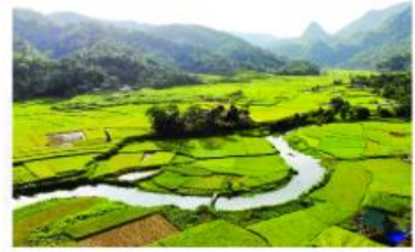
Cảnh đồng lúa Lũng Cao, Thanh Hoá