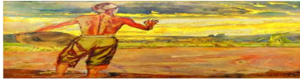
Bình minh trên nông trường, sơn mài, Nguyễn Đức Năng, 1958