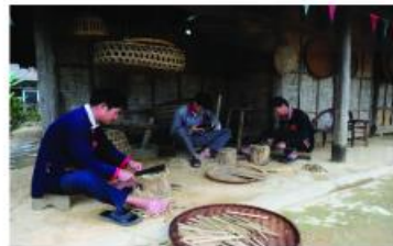
Nghề làm dũa