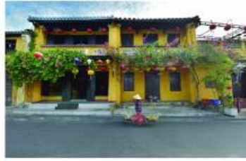
Phố cổ Hội An, Quảng Nam