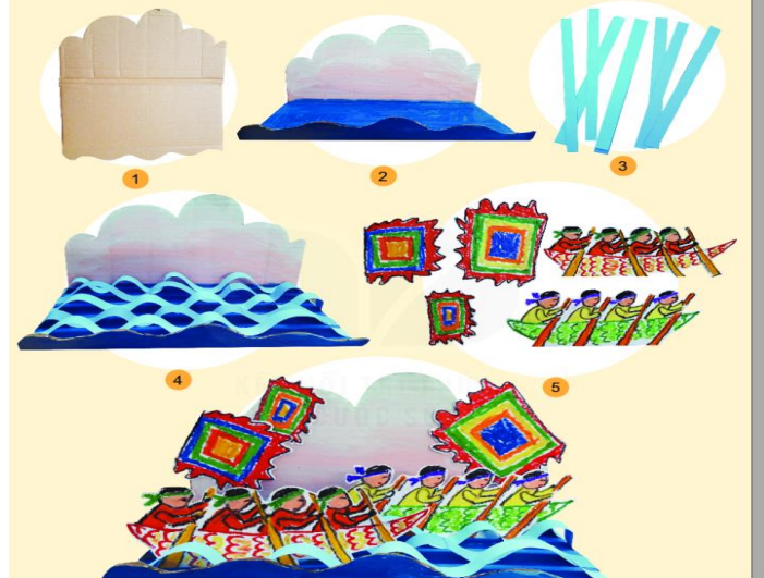
Cách thể hiện hoà sắc trong sản phẩm mỹ thuật 3D về chủ đề lễ hội

Chủ đề về lễ hội quen thuộc trong các sáng tác mỹ thuật. Nhiều tác phẩm mỹ thuật đã sử dụng những màu sắc tươi vui để thể hiện không khí rộn ràng, náo nức trong lễ hội. Những hoạt động như: đoàn rước, múa,... là nguồn cảm hứng để tạo nên các bố cục hấp dẫn, sinh động.