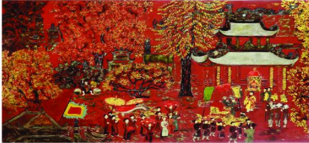
Lễ hội đầu năm, tranh sơn mài, Nguyễn Gia Trí

Trong tác phẩm Lễ hội đầu năm để thể hiện không khí tung bừng, náo nhiệt của lễ hội, hoạ sĩ Nguyễn Gia Trí đã sử dụng hoà sắc màu nóng, ấm. Gam màu chủ đạo là đỏ, vàng, nâu đã được tác giả sắp xếp khéo léo, xen kẽ những mảng màu xanh tạo nên nhịp điệu hài hoà, cân đối: Bức tranh là tổng hoà của những mảng màu nóng, lạnh ca ngợi vẻ đẹp của thiên nhiên và con người trong lễ hội mùa xuân.