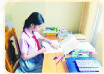
Ôn bài