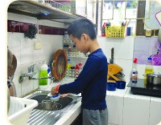
Rửa bát