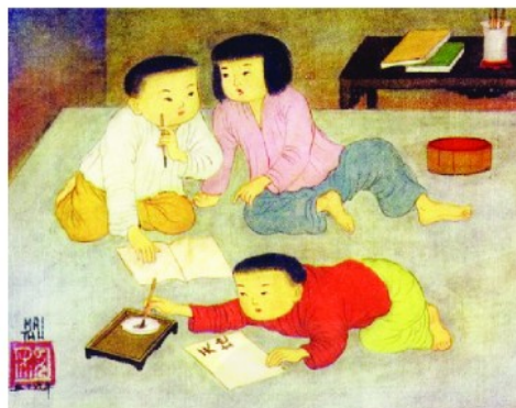
Viết bài, tranh lụa, 1956