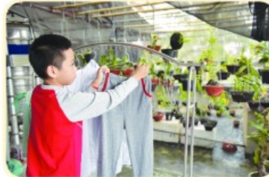
Phơi quần áo