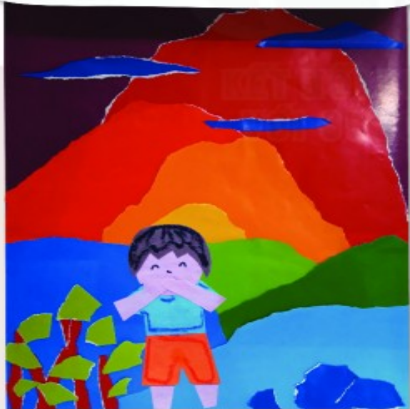
Sản phẩm mỹ thuật trang trí túi đựng bài mỹ thuật, Mai Bá Huỳnh

Sử dụng các hình ảnh cuộc sống thường ngày để trang trí một đồ dùng học tập mà em yêu thích